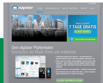
Präsentiert sich in neuem Design: Napster

Online-Portal Napster hat seine Consumer-Seiten überarbeitet und bietet neuerdings auch einen „MoodManager“, mit dem die richtige Musik zur jeweiligen Stimmung des Users anhand einer Farbskala zusammengestellt wird.